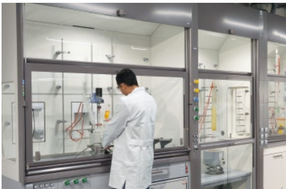
Größte Sicherheit bei der Arbeit im Labor